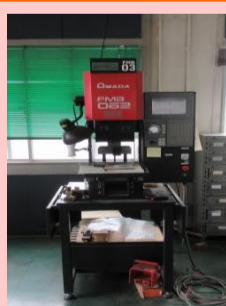
NCベンダー アマダ FMB-062 2005年製 管理番号:G005369 置場:東京都八王子市