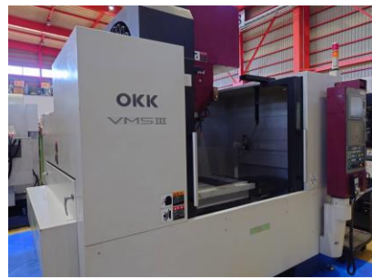
立型マシニングセンター OKK VM5III 2004年製 Neomatic635V BT50 管理番号:P008463 置場:東日本マシンプラザ