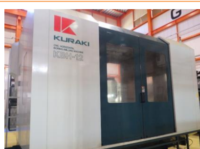
NC横中ぐり盤 倉敷機械 KBH-12 2007年製 FANUC16i-MB BT50 管理番号:H015805 置場:マシンプラザ本庄