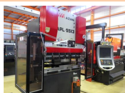
NCバンダー 相澤鐵工所 APL-5513 2015年製 55t テーブル長さ1300 管理番号:H018251 置場:マシンプラザ本庄