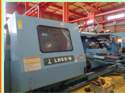
フラット型NC旋盤 オークマ LH55-NB 1996年製 OSP7000L φ750.4爪単動チャック 管理番号:P006389 置場:東日本マシンプラザ