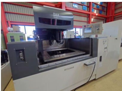
NCワイヤーカット 三菱電機 FA30VM 2003年製 W21FAV-2 管理番号:P008433 置場:東日本マシンプラザ