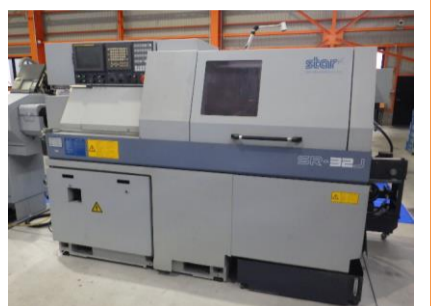
NC自動盤 スター精密 SR-32J 2011年製 FANUC18i-TB ローターガイドブッシュ 管理番号:H017821 置場:マシンプラザ本庄