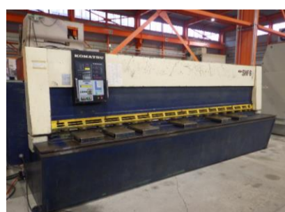
シャーリング コマツ SHF6×410 1989年製 6.5×4100 オートパッケージ付 管理番号:H017409 置場:マシンプラザ本庄