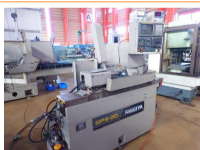
NC円筒研削盤 シギヤ精機 GPS-20・50 1999年製 FANUC POWER MATE 管理番号:P008265 置場:東日本マシンプラザ