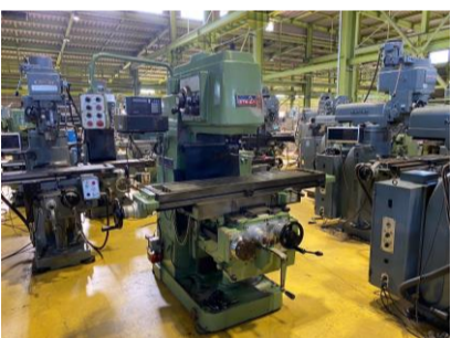
ひざ型フライス 大隈豊和 STM-2V 1988年製 NT50 テーブルサイズ1500×310 管理番号:H017915 置場:マシンプラザ本庄