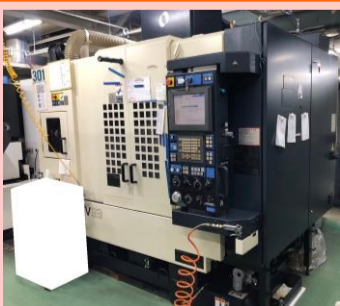
立型マシニングセンター 牧野フライス V33 2004年製 Professional5 HSK-F63 管理番号:G005359 置場:東京都八王子市