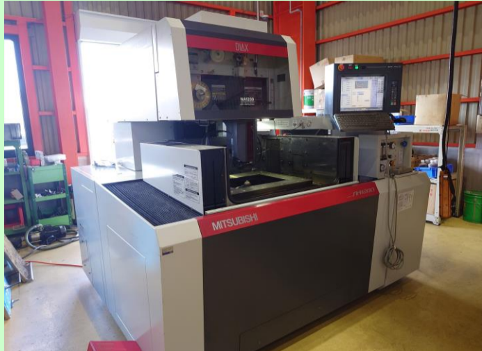
NCワイヤーカット 三菱電機 NA1200 2012年製 W31NA-2 テーブルサイズ*590×514 管理番号:P008315 置場:東日本マシンプラザ ¥7,500,000 → ¥6,800,000