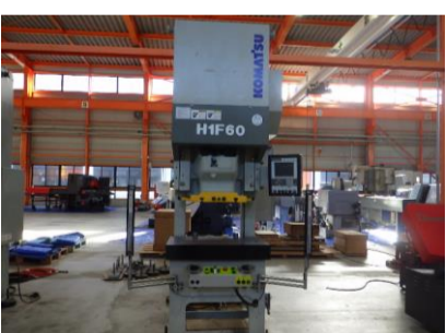
サーボプレス コマツ H1F60-11 2008年製 60t ストローク数-85 管理番号:H018134 置場:マシンプラザ本庄