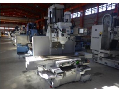
簡易型NCフライス 山崎技研 YZ-8CR 1995年製 FANUC20-F NT50 管理番号:H017275 置場:マシンプラザ本庄