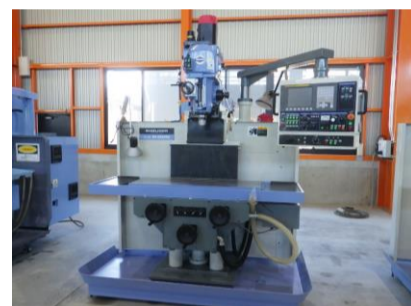
NC立フライス 静岡鐵工所 R-3VN 2017年製 FANUC0i-MF NT40 管理番号:H018101 置場:マシンプラザ本庄