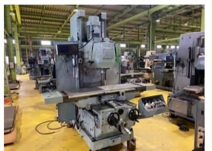
ペット型フライス 武田機械 TK-VS3N-LH 1990年製 NT50 テーブルサイズ1600×400 管理番号:H017510 置場:マシンプラザ本庄