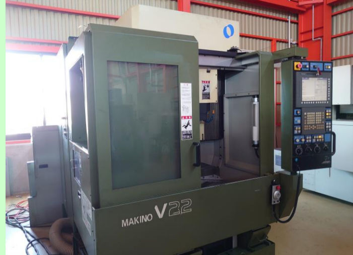
立型マシニングセンター 牧野フライス V22 2005年製 Professional5 HSK-E32 管理番号:P007691 置場:東日本マシンプラザ ¥7,500,000 → ¥5,500,000