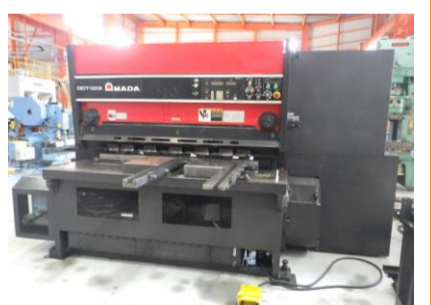
シャーリング アマダ DCT-1213 1993年製 13×1260 電動クランプ 管理番号:H016028 置場:マシンプラザ本庄