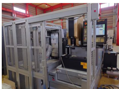
NC放電加工機 ソディック AP1L 2007年製 LQ1 ATC60本 管理番号:P007709 置場:東日本マシンプラザ