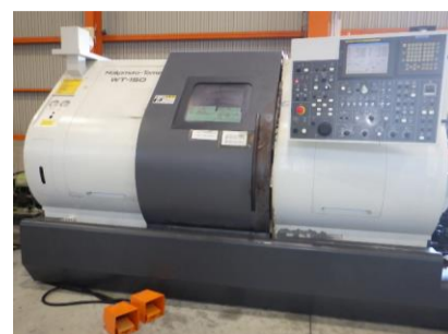
NC自動盤 中村留精密工業 WT-150 2005年製 FANUC18i-TB メイン:コレットチャック 管理番号:H018105 置場:マシンプラザ本庄