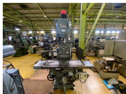
ラム型フライス 牧野フライス BVIIIJ-85 1989年製 NT40 テーブルサイズ1350×400 管理番号:H017931 置場:マシンプラザ本庄