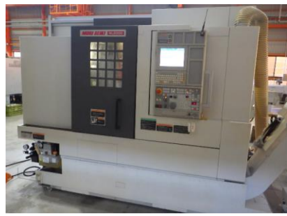
複合NC旋盤 森精機 NL2000Y/500 2013年製 M720BM 8吋3爪チャック(北川) 管理番号:H018144 置場:マシンプラザ本庄