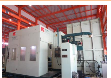
NC横中ぐり盤 倉敷機械 KBT-11M-ANT8P 2002年製 BT50(2面拘束) テーブル(チャック)サイズ 管理番号:H013773 置場:マシンプラザ本庄