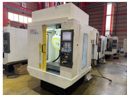
ドリリングセンター ファナック α-T14iF 2007年製 FANUC31i-A BBT30 管理番号:P008472 置場:東日本マシンプラザ