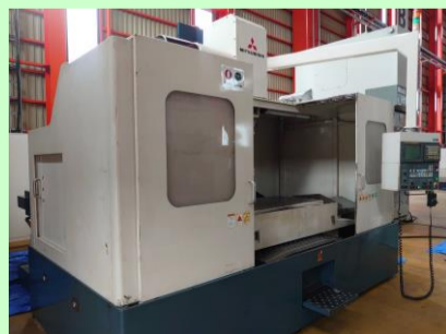
立型マシニングセンター 三菱重工業 M-V60EN 2002年製 FANUC-18i-M BT50 管理番号:P007856 置場:東日本マシンプラザ