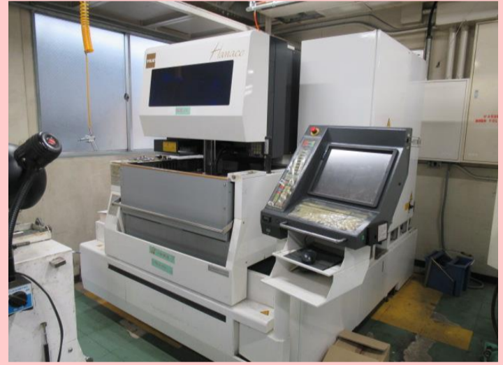
NCワイヤーカット ソディック AQ360L 2008年製 LN1W 管理番号:G005366 置場:東京都八王子市