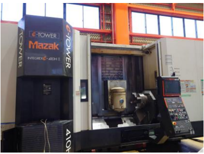
複合NC旋盤 ヤマザキ INTEGREX-e-410HS II 2008年製 MAZATROL MATRIX 管理番号:P008458 置場:東日本マシンプラザ