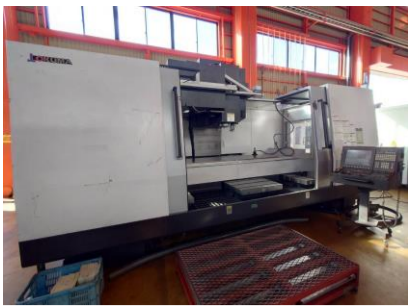
立型マシニングセンター オークマ MILLAC-852V II 2015年製 OSP-P300M BT50 管理番号:P008424 置場:東日本マシンプラザ