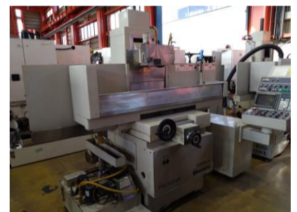
NC平面研削盤 岡本工作 PSG-52EXB 2005年製 チャックサイズ500×200 管理番号:P008041 置場:東日本マシンプラザ