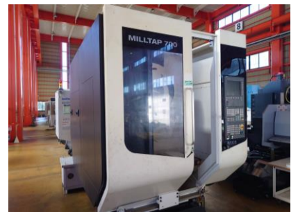
タッピングセンター 森精機 MILLTAP700 2015年製 SINUMERIK BBT30 管理番号:P008396 置場:東日本マシンプラザ