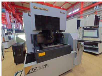
NCワイヤーカット ソディック AQ327L 2006年製 LQ33W 管理番号:P008436 置場:東日本マシンプラザ