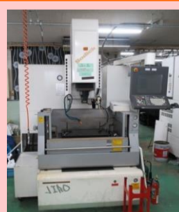
NC放電加工機 ソディック AM30L 2009年製 LC1 テーブルサイズ600×400 管理番号:G005349 置場:東京都八王子市