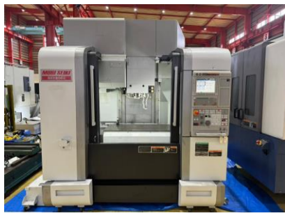
立型マシニングセンター 森精機 NVX5080/40 2011年製 MSX-853IV(MELDAS) BT40 管理番号:P008464 置場:東日本マシンプラザ