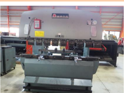
バンダー アマダ RG-80S 1987年製 80t ストローク長さ100 管理番号:H018192 置場:マシンプラザ本庄