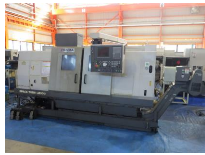
NC旋盤 オークマ LB300 2005年製 OSP-E100L 8吋3爪チャック 管理番号:H018081 置場:マシンプラザ本庄