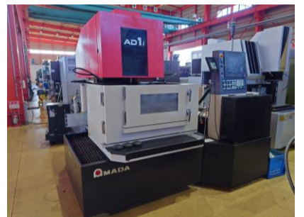
NCワイヤーカット アマダ AD1 2017年製 FANUC-31i-WB ワイヤ径0.1-0.3 管理番号:P008235 置場:東日本マシンプラザ