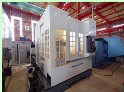
立型マシニングセンター 北村 Mycenter-2XiH 2004年製 FANUC16i-MB BBT40 管理番号:P008196 置場:東日本マシンプラザ