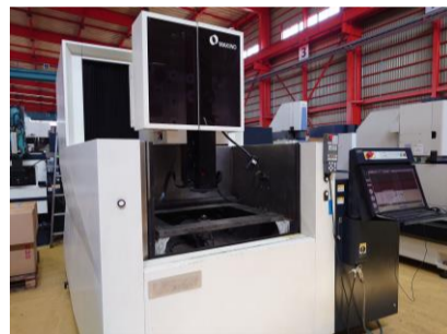
NCワイヤーカット 牧野フライス U6H.E.A.T 2014年製 Hyper i 管理番号:P008298 置場:東日本マシンプラザ