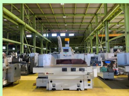
平面研削盤 テクノワシ TECHSTER D1 2008年製 チャックサイズ*600×400 管理番号:H017407 置場:マシンプラザ本庄