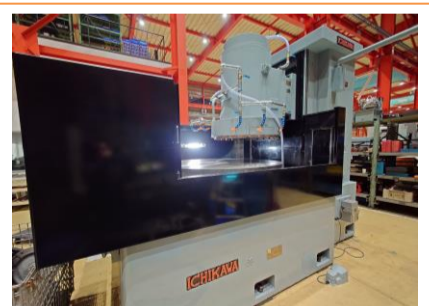
ロータリー研削盤 市川 ICB-1900 1983年製 チャックサイズΦ1650 管理番号:P008136 置場:東日本マシンプラザ