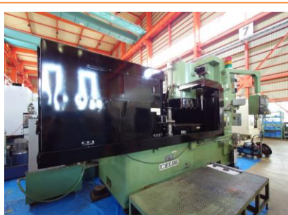
NCロータリー研削盤 市川 ICB-1500NC 2002年製 チャックサイズφ1400 管理番号:P007869 置場:東日本マシンプラザ