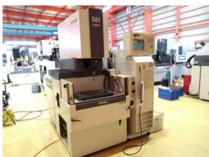
NC放電加工機 三菱電機 EA8PVM 2006年製 C21EA-2 テーブルサイズ500×350 管理番号:P008076 置場:東日本マシンプラザ