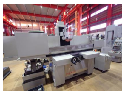
NC平面研削盤 岡本工作 PSG105EXB 2001年製 OKAMOTO PRECISION(FANUC) 管理番号:P008264 置場:東日本マシンプラザ