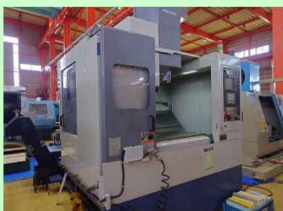
立型マシニングセンター 森精機 SV-500/40S 1997年製 MSD-516(FANUC) BBT40 管理番号:P008255 置場:東日本マシンプラザ