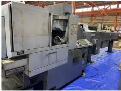
NC自動盤 シチズン A20VIL 2008年製 FANUC 管理番号:H018197 置場:マシンプラザ本庄