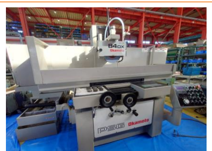
平面研削盤 岡本工作 PSG-84DX 1996年製 チャックサイズ800×400 管理番号:H017723 置場:東日本マシンプラザ