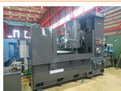
ロータリー研削盤 市川 ICB-1500 2019年12月O/H年製 チャックサイズφ1300 管理番号:P005367 置場:東日本マシンプラザ