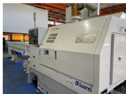
NC自動盤 ミヤノ BNE-51S 1998年製 FANUC18-T 管理番号:H017837 置場:マシンプラザ本庄