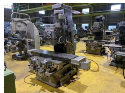
ペット型フライス 山崎技研 YZ-8C 1997年製 NT50 テーブルサイズ1500×350 管理番号:H017731 置場:マシンプラザ本庄