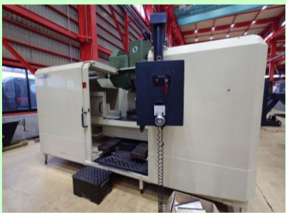
立型マシニングセンター 牧野フライス GF6 1998年製 Professional3 BT50 管理番号:P007672 置場:東日本マシンプラザ