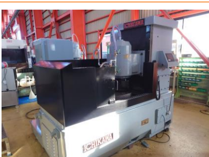
ロータリー研削盤 市川 ICB-240 テーブル径610Φ オーバーホール済 管理番号:P008240 置場:東日本マシンプラザ