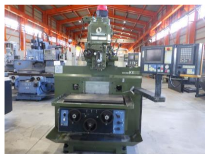
NC立フライス 牧野フライス KEVA-55 1995年製 ProfessionalJN NT40 管理番号:H018078 置場:マシンプラザ本庄