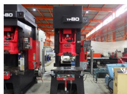
C型プレス アマダ TP-80 1993年製 80t ストローク数70spm 管理番号:H017688 置場:マシンプラザ本庄