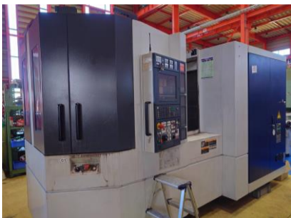
横型マシニングセンター 森精機 NH4000 2004年製 MSG-501 BT40 管理番号:P007978 置場:東日本マシンプラザ