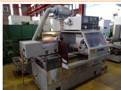
NC内面研削盤 岡本工作 IGM-15NC 2009年製 FANUC18i-TB 管理番号:P008122 置場:東日本マシンプラザ