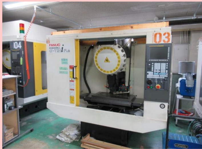
ドリリングセンター ファナック α-T21iFLa 2009年製 FANUC31i-A5 BT30 管理番号:G005355 置場:東京都八王子市