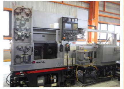
複合NC旋盤 アマダ AA-1 2012年製 FANUC31i-A 平行2スピンドル 管理番号:H017865 置場:マシンプラザ本庄