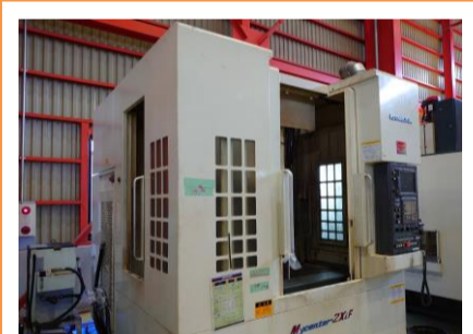
立型マシニングセンター 北村 Mycenter-2XiF 2005年製 FANUC16i-MB BT40 管理番号:P007776 置場:東日本マシンブラザ