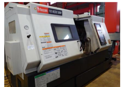
複合NC旋盤 ヤマザキマザック QTN-300M 2005.2年製 MAZATROL 640T NEXUS 管理番号:P007479 置場:東日本マシンプラザ