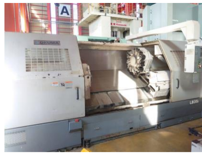
NC旋盤 オークマ LB35 II 2006年製 OSP-E100L 管理番号:P007126 置場:東日本マシンプラザ