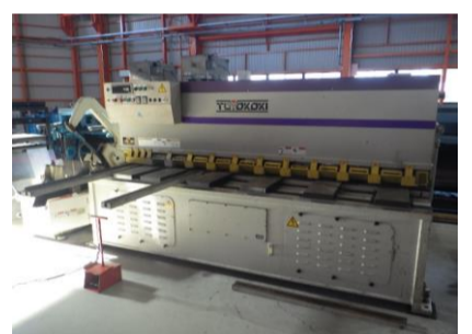
シャーリング 東洋工機 HSS-2565 2004年製 6.5×2500 管理番号:H016508 置場:マシンプラザ本庄