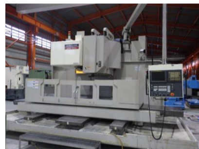
立型マシニングセンター 大隈豊和 MILLAC-1052V 2003.3年製 FANUC16i-M BT50 管理番号:H016030 置場:マシンブラザ本庄