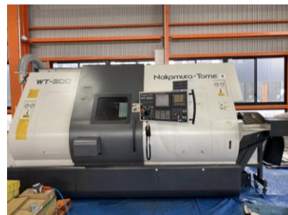
複合NC旋盤 中村留 WT-300MMY 2007年製 FANUC18iTB 管理番号:H016548 置場:マシンプラザ本庄