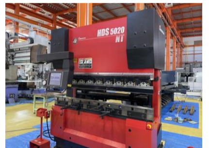
NCベンダー アマダ HDS-5020NT 2004年製 NT 50t 2070 管理番号:H016439 置場:マシンプラザ本庄