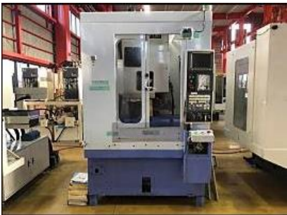
タッピングセンター 池貝ワドー FPC-31VT 1999年製 FANUC21-M 管理番号:P007737 置場:東日本マシンブラザ