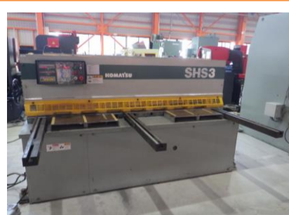
シャーリング コマツ SHS3×205 1996年製 3×2050 管理番号:H016392 置場:マシンプラザ本庄