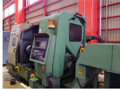
NC旋盤 森精機 SL-65A 1993年製 MF-T6(FANUC) 15吋 管理番号:P007764 置場:東日本マシンプラザ