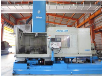
立型NC旋盤 オーエム OMEGA60M 2004年製 FANUC18i-TB 管理番号:H015395 置場:マシンプラザ本庄