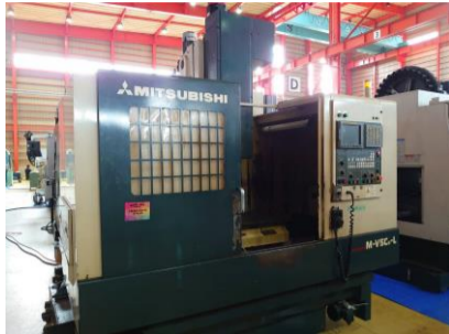
立型マシニングセンター 三菱重工業 M-V5CNL 2003年製 FANUC-18i-M BT40 管理番号:P007666 置場:東日本マシンブラザ