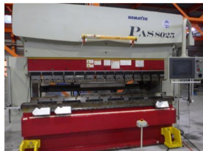
NCサーボハンダー コマツ PAS8025NET 2008.5年製 80t 2550 管理番号:H016041 置場:マシンプラザ本庄