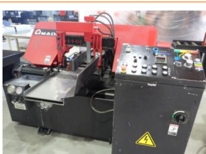
バンドソー アマダ HA-250 2002年製 切断能力250 送り付 管理番号:H016523 置場:マシンプラザ本庄