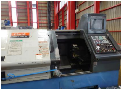
NC旋盤 ヤマザキマザック QT-20 1997年製 MAZATROL T PLUS 8吋 管理番号:P007787 置場:マシンプラザ本庄