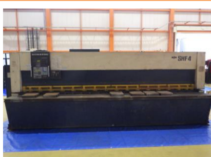
シャーリング コマツ SHF4×410 1991年製 4.5×4100 管理番号:H016348 置場:マシンプラザ本庄