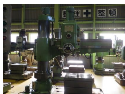
ラジアルボール盤 森精機 YR5-130 年製 管理番号:H016551 置場:マシンプラザ本庄