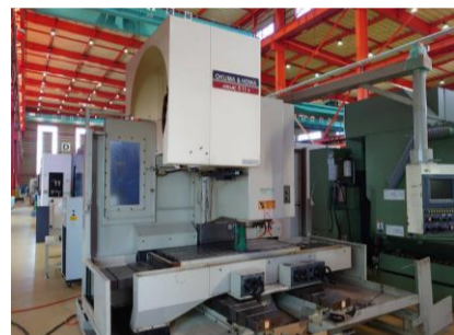
立型マシニングセンター 大隈豊和 MILLAC-511V 1999.3年製 OSP-U100M BT40 管理番号:P007750 置場:東日本マシンブラザ