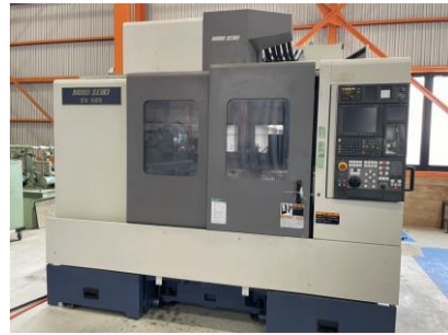
立型マシニングセンター 森精機 SV-503B/40 2001年製 MSX-501III(FANUC) BT40 管理番号:H016491 置場:マシンブラザ本庄