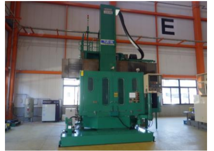
立型NC旋盤 東芝機械 TUD-16 2001.3年製 FANUC150-T 管理番号:H016180 置場:マシンプラザ本庄