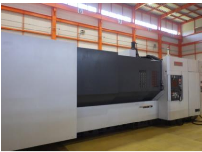
門型マシニングセンター 森精機 VS10000/40/3150 2006.8年製 MSX-501III(FANUC) BT40 管理番号:H015516 置場:マシンプラザ本庄