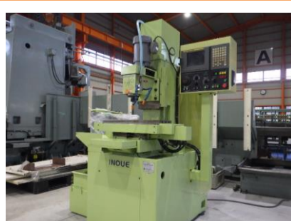
NC立フライス 井上 INC-20 2007年製 FANUC21i-MB 管理番号:H016532 置場:マシンプラザ本庄