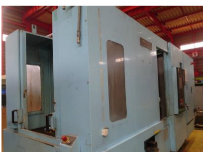
横型マシニングセンター 森精機 NH5000/40 2006年製 MSX-501(FANUC) BT40 管理番号:P007770 置場:東日本マシンブラザ