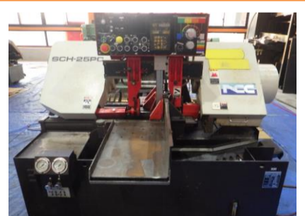
バンドソー ニコテック SCH-25PC 1998年製 丸材φ250 角材W300×H250 送 管理番号:H016536 置場:マシンプラザ本庄