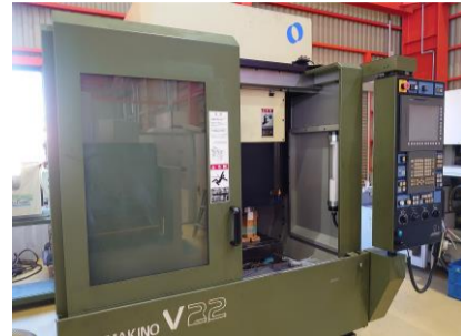
立型マシニングセンター 牧野フライス V22 2005年製 Professional5 HSK-E32 管理番号:P007691 置場:東日本マシンブラザ