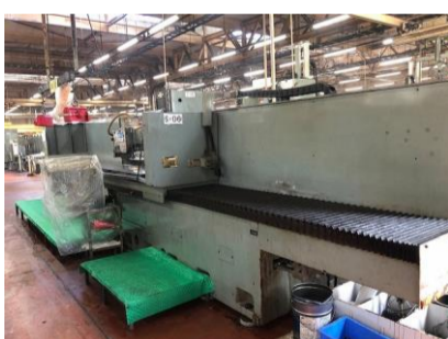
NC平面研削盤 岡本工作 PSG-355EXZ 2001.4年製 FANUC チャックサイズ3500×500 管理番号:P007344 置場:東日本マシンプラザ