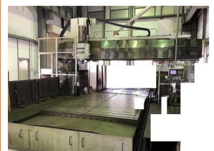
五面加工機 三菱 MVR40 2006.4年製 FANUC18i-MB BT50 管理番号:H014504 置場:マシンブラザ本庄