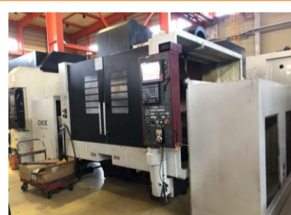
立型マシニングセンター OKK VM7III 2007年製 Neomatic730 BT50 管理番号:P007759 置場:東日本マシンブラザ