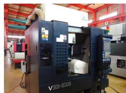
五軸加工機 牧野フライス V33-5XB 2007.1年製 Professional HSK-F63 管理番号:P007468 置場:東日本マシンブラザ