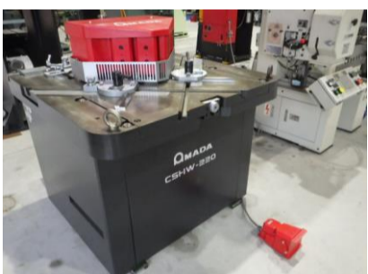
コーナーシャー アマダ CSHW-220 2011.6年製 25t 管理番号:H016253 置場:マシンプラザ本庄