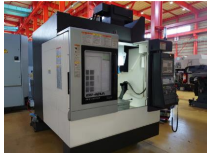
立型マシニングセンター オークマ MB-46VA 2016年製 OSP-P300M BT40 管理番号:P007755 置場:東日本マシンブラザ