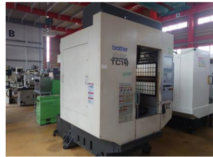
タッピングセンター ブラザー TC-S2C 2007年製 CNC-B00 管理番号:P007700 置場:東日本マシンブラザ