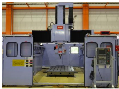
門型五軸加工機 新日本工機 MKS-2000/3100/5C 2008.3年製 FANUC31iA5 HSK-A63 管理番号:H014114 置場:マシンプラザ本庄