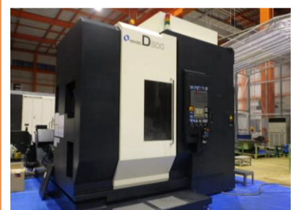
五軸加工機 牧野フライス D500 2008.9年製 Professional 5 HSK-A63 管理番号:H015918 置場:マシンブラザ本庄