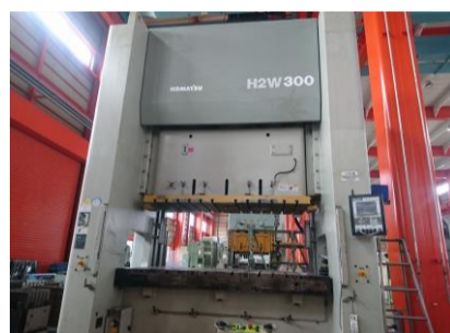
サーボプレス コマツ H2W300 2007.8年製 300t 管理番号:P006330 置場:東日本マシンプラザ