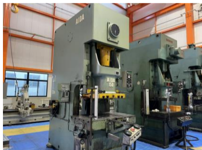
C型プレス アイダ NC1-150(2) 1990年製 150t ダイクション付 管理番号:H016445 置場:マシンプラザ本庄