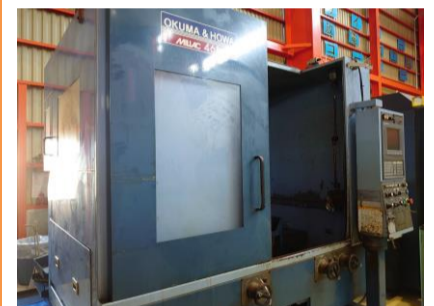
立型マシニングセンター 大隈豊和 MILLAC-468V 2003.8年製 OH-OSP-HMi BT50 管理番号:P007626 置場:東日本マシンブラザ