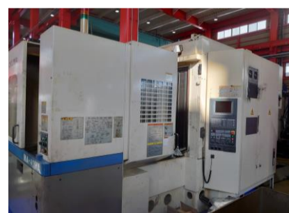
横型マシニングセンター オークマ MA-40HA 2001年製 OSP-E100M BT40 管理番号:P007747 置場:東日本マシンブラザ