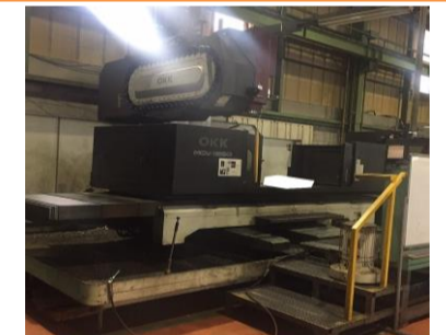
立型マシニングセンター OKK MCV-1260 2007.2年製 FANUC160is-MB BT50 管理番号:H016444 置場:マシンブラザ本庄