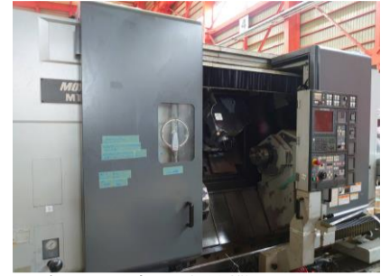
複合NC旋盤 森精機 MT2000 alpha 1SZ 2003年製 MSD-502 管理番号:P007756 置場:東日本マシンプラザ