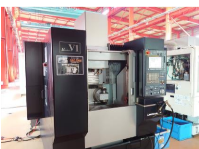
五軸加工機 三菱重工業 μV1-5X 2011年製 FANUC31i-MODEL A5 HSK-E32 管理番号:P004297 置場:東日本マシンブラザ