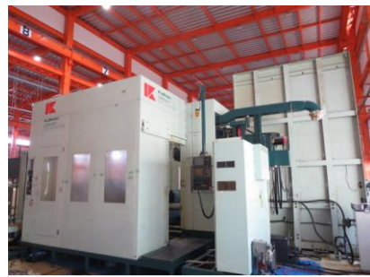
NC横中ぐり盤 倉敷 KBT-11M-ANT8P 2002.12年製 FANUC-16iMB 管理番号:H013773 置場:マシンプラザ本庄