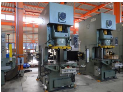
C型プレス アイダ NC1-110(2) 1991年製 110t ダイクション付 管理番号:H016446 置場:マシンプラザ本庄