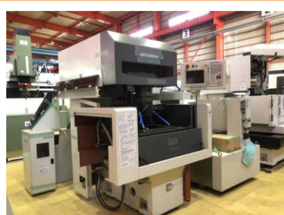
NCワイヤーカット 三菱電機 FA10SM 2004年製 W21FAS-2 管理番号:P007785 置場:東日本マシンプラザ