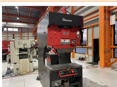
万能ベンダー アマダ SPH-60C 1998年製 60t 1000 管理番号:H016501 置場:マシンプラザ本庄