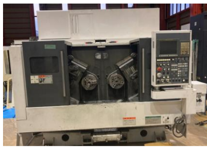
NC旋盤 滝沢 TT-2600 2016年製 FANUC0i-TD 平行2スピンドル 管理番号:P007741 置場:東日本マシンプラザ