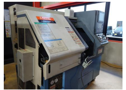
NC旋盤 ヤマザキマザック QT-10 1999年製 MAZATROL640T 管理番号:P007744 置場:東日本マシンプラザ