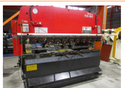
ベンダー アマダ RG-80 1998年製 80t 2400 管理番号:H016249 置場:マシンプラザ本庄