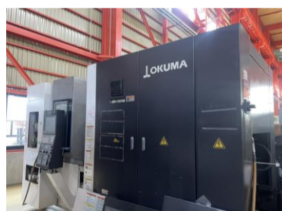
横型マシニングセンター オークマ MB-4000H 2012年製 OSP-P300M BBT40 管理番号:P007732 置場:東日本マシンブラザ