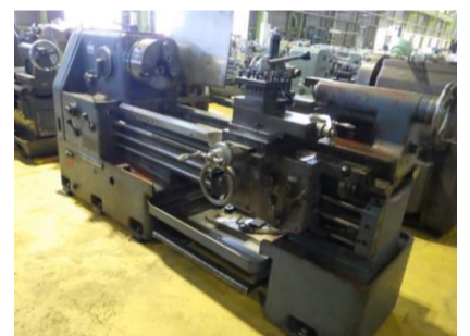
汎用旋盤 滝沢 TAL-560 年製 12吋3爪スクロールチャック(JN12T) 管理番号:H016601 置場:マシンプラザ本庄