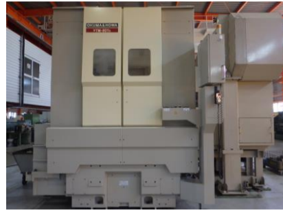
立型NC旋盤 大隈豊和 VTM-80YB 2002.4年製 FANUC18i-T 管理番号:H015588 置場:マシンプラザ本庄