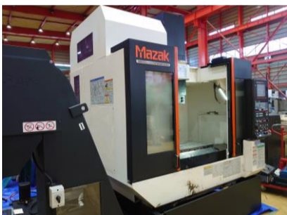
立型マシニングセンター ヤマザキマザック VCS-430A 2012年製 MAZATROL smart BT40 管理番号:P007651 置場:東日本マシンブラザ