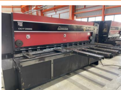
シャーリング アマダ DCT-2565 1987年製 6.5×2500 管理番号:H016502 置場:マシンプラザ本庄