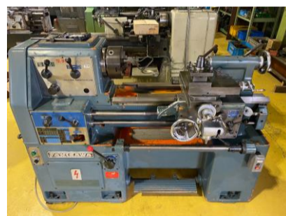
汎用旋盤 滝沢 TSL-550D 1982年製 【学校で使用されていた機械で 管理番号:H016633 置場:マシンプラザ本庄