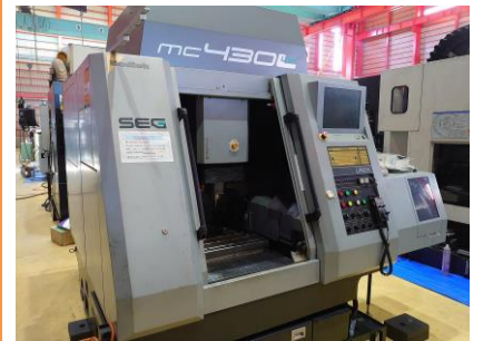
立型マシニングセンター ソディック MC430L 2005年製 HSK-E32 管理番号:P007707 置場:東日本マシンブラザ