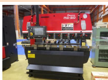
ベンダー アマダ RG-50 2007年製 50t 2000 管理番号:H016254 置場:マシンプラザ本庄