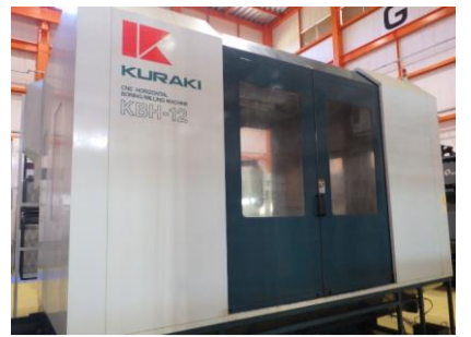
NC横中ぐり盤 倉敷機械 KBH-12 2007.11年製 FANUC16i-MB 管理番号:H015805 置場:マシンプラザ本庄