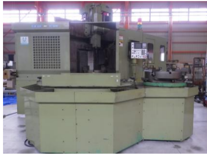
立型NC旋盤 オーエム VC-8NM 2000年製 テーブルサイズφ800 管理番号:H015064 置場:マシンプラザ本庄