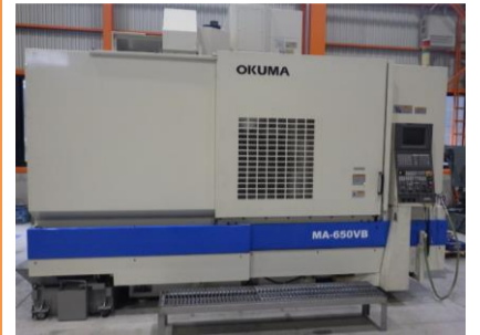
立型マシニングセンター オークマ MA-650VB 2002.6年製 OSP-E100M BT50 管理番号:H016017 置場:マシンブラザ本庄