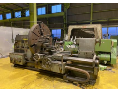
正面旋盤 藤井精機 60-6FLH-15 1983年製 1500φ4爪単動チャック 心間1500 管理番号:H016632 置場:マシンプラザ本庄