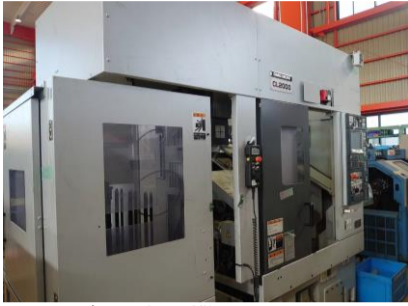
NC旋盤 森精機 CL2000B 2015年製 M730BM 8吋 管理番号:P007695 置場:東日本マシンプラザ