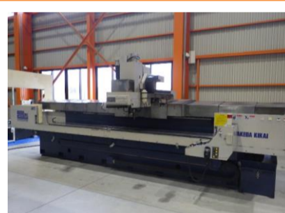
立型マシニングセンター 武田機械 TK45S-4000MV-4 2006.12年製 FANUC0i-MC BT40 管理番号:H016183 置場:マシンブラザ本庄