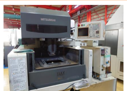
NCワイヤーカット 三菱電機 FA10SM 2006年製 W30FAS-2 管理番号:P007717 置場:東日本マシンプラザ