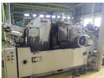
センターレス NTC CLG-2B II 1990年製 砥石サイズ610×205×304.8 管理番号:H016378 置場:マシンプラザ本庄