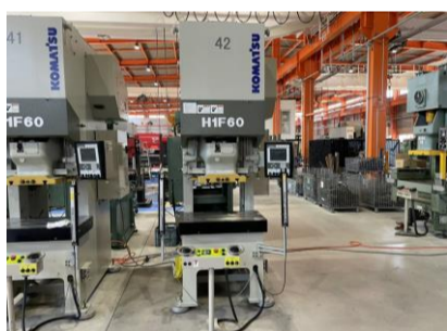
サーボプレス コマツ H1F60-11 2010年製 60t 管理番号:H016157 置場:マシンプラザ本庄