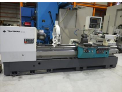
簡易型NC旋盤 滝沢 TAC-650 1994年製 FANUC20T 管理番号:H016370 置場:マシンプラザ本庄