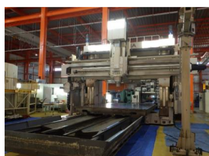
五面加工機 オークマ MCR-B II 35x50 2004.7年製 OSP-E100M BBT50 管理番号:H015701 置場:マシンブラザ本庄