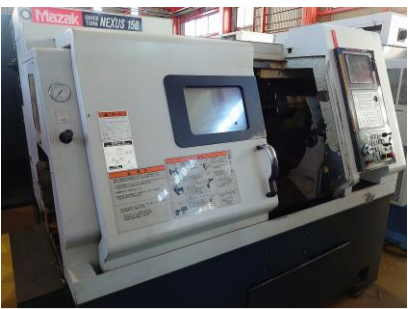
NC旋盤 ヤマザキマザック QTN-150/500 2004年製 MAZATROL640T NEXUS 管理番号:P007746 置場:東日本マシンプラザ