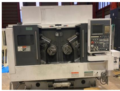
NC旋盤 滝沢 TT-2600 2016年製 FANUC0i-TD 平行2スピンドル 管理番号:P007741 置場:東日本マシンプラザ