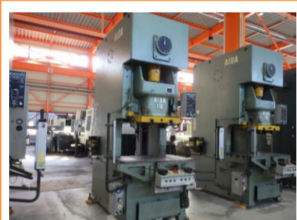
C型プレス アイダ NC1-110(2) 1991年製 110t タイクッション付 管理番号:H016448 置場:マシンプラザ本庄