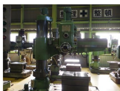
ラジアルボール盤 森精機 YR5-130 年製 管理番号:H016551 置場:マシンプラザ本庄