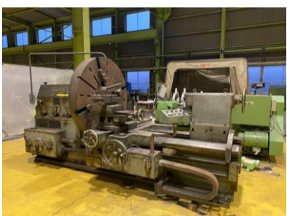
正面旋盤 藤井精機 60-6FLH-15 1983年製 1500φ4爪単動チャック 心間1500 管理番号:H016632 置場:マシンプラザ本庄