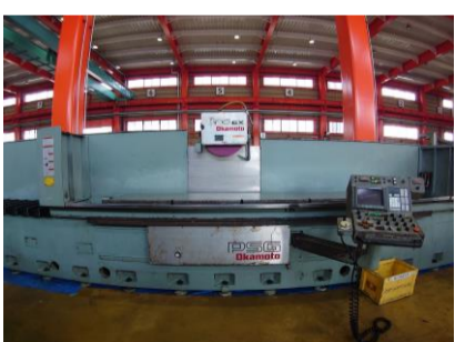
NC平面研削盤 岡本工作 PSG-355EXZ 2001.4年製 FANUC チャックサイズ3500×500 管理番号:P007344 置場:東日本マシンプラザ