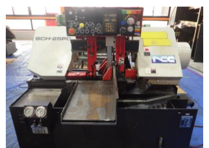
バンドソー ニコテック SCH-25PC 1998年製 丸材φ250 角材W300×H250 送 管理番号:H016536 置場:マシンプラザ本庄