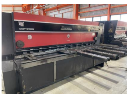
シャーリング アマダ DCT-2565 1987年製 6.5×2500 管理番号:H016502 置場:マシンプラザ本庄