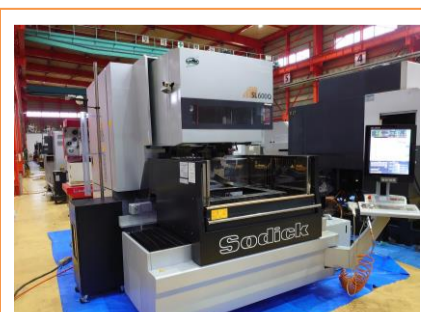
NCワイヤーカット ソディック SL600Q 2015年製 SPW 管理番号:P007809 置場:東日本マシンプラザ