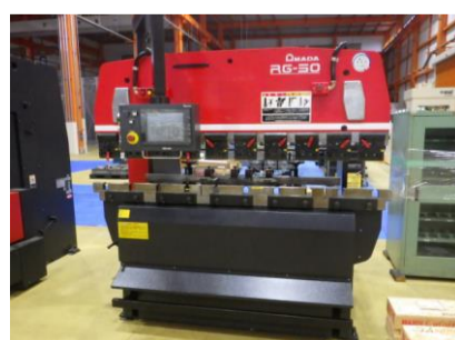
ベンダー アマダ RG-50 2007年製 50t 2000 管理番号:H016254 置場:マシンプラザ本庄