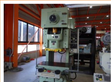
C型プレス アイダ NC1-45(2) 1989年製 45t 管理番号:H016450 置場:マシンプラザ本庄