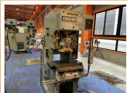
C型プレス コマツ OBS15-B 2000年製 15t 管理番号:H016751 置場:マシンプラザ本庄