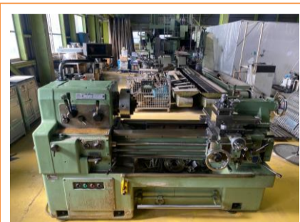
汎用旋盤 森精機 MS-850 年製 管理番号:H016640 置場:マシンプラザ本庄