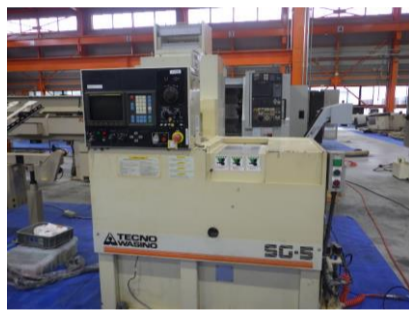
楕円型NC旋盤 テクノワシノ SG-5 1996.7年製 FANUC0-T コレットチャック 管理番号:H016430 置場:マシンプラザ本庄