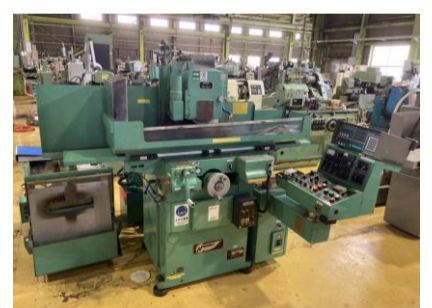
平面研削盤 長島精工 NTP415-F·RD 2001年製 管理番号:H016441 置場:マシンプラザ本庄