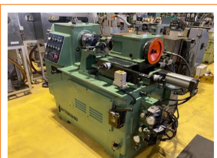
ポリゴンマシン 日東工機 PC-125 1990年製 管理番号:H016707 置場:マシンプラザ本庄