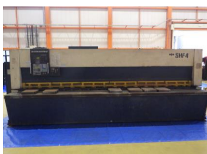
シャーリング コマツ SHF4×410 1991年製 4.5×4100 管理番号:H016348 置場:マシンプラザ本庄