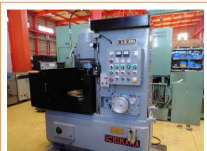
ロータリー研削盤 市川製作所 ICB-603 1991年製 チャックサイズφ500 ★2022年O/H 管理番号:P007466 置場:東日本マシンプラザ