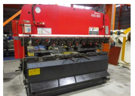
ベンダー アマダ RG-80 1998年製 80t 2400 管理番号:H016249 置場:マシンプラザ本庄