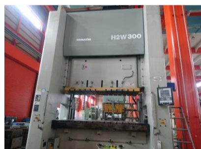
サーボプレス コマツ H2W300 2007.8年製 300t 管理番号:P006330 置場:東日本マシンプラザ