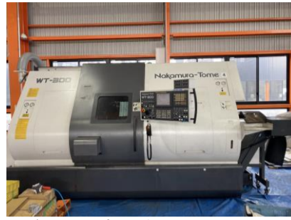
複合NC旋盤 中村留 WT-300MMY 2007年製 FANUC18iTB 管理番号:H016548 置場:マシンプラザ本庄