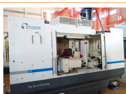
NC円筒研削盤 スチューダー S31CNC 2012年製 FANUC18i-TB 管理番号:P007754 置場:東日本マシンプラザ