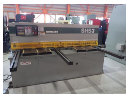
シャーリング コマツ SHS3×205 1996年製 3×2050 管理番号:H016392 置場:マシンプラザ本庄