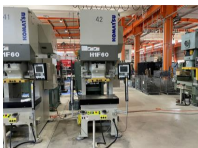
サーボプレス コマツ H1F60-11 2010年製 60t 管理番号:H016157 置場:マシンプラザ本庄