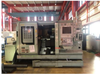
NC旋盤 森精機 NZX-2500/600 2016年製 M730BM 管理番号:P007763 置場:東日本マシンプラザ