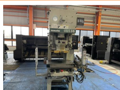
C型プレス コマツ OBS35-33B 2002年製 35t 管理番号:H016754 置場:マシンプラザ本庄