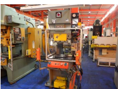
万能ベンダー アマダ SPH-30C 1986年製 30t ストローク長さ100 管理番号:H016581 置場:マシンプラザ本庄