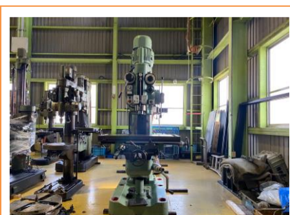
直立ボール盤 吉田 YD5-94CTN 年製 MT5 テーブルサイズ1000×500 管理番号:H016598 置場:マシンプラザ本庄