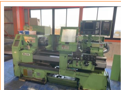
簡易型NC旋盤 大日金属 DL530×100 年製 FANUC20i-T 10吋 管理番号:H016646 置場:マシンプラザ本庄