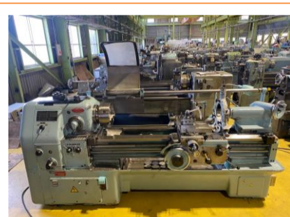
汎用旋盤 オークマ LS 年製 10吋3爪スクロールチャック 管理番号:H016567 置場:マシンプラザ本庄