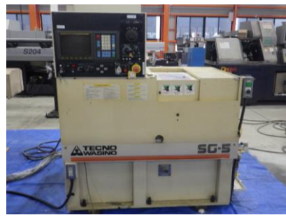
楕円型NC旋盤 テクノワシノ SG-5 1995.1年製 FANUC0-T コレットチャック 管理番号:H016431 置場:マシンプラザ本庄