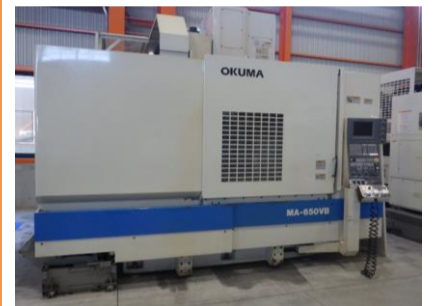
立型マシニングセンター オークマ MA-650VB 2001年製 OSP-U100L BT50 管理番号:H016303 置場:マシンブラザ本庄