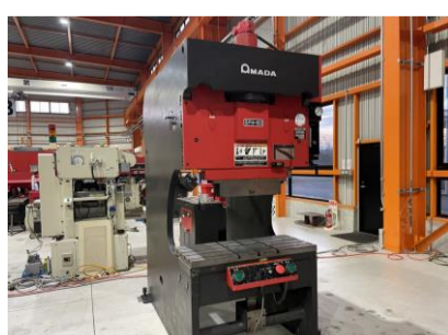
万能ベンダー アマダ SPH-60C 1998年製 60t 1000 管理番号:H016501 置場:マシンプラザ本庄