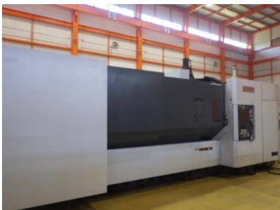
門型マシニングセンター 森精機 VS10000/40/3150 2006.8年製 MSX-501III(FANUC) BT40 管理番号:H015516 置場:マシンプラザ本庄