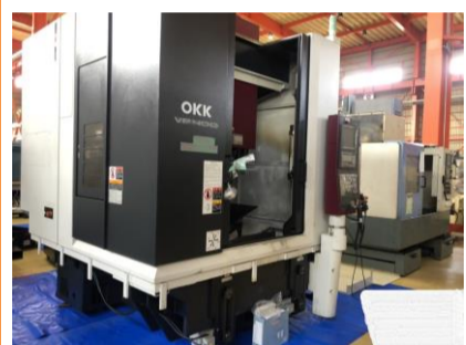
立型マシニングセンター OKK VP400 2014年製 FANUC 31i-MODEL A BT40 管理番号:P007803 置場:東日本マシンプラザ