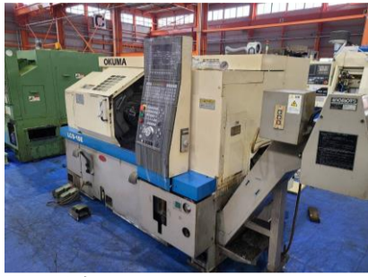
NC旋盤 オークマ LCS-15E 1996年製 管理番号:H016765 置場:マシンプラザ本庄