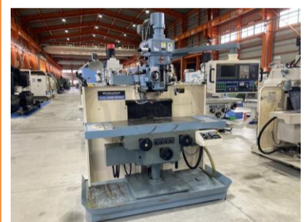
NC立フライス 静岡鉄工 AN-SRN 2004年製 FANUC20i-F NT40 管理番号:H016688 置場:マシンプラザ本庄