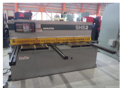
シャーリング コマツ SHS3×205 1996年製 3×2050 管理番号:H016392 置場:マシンプラザ本庄