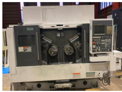
NC旋盤 滝沢 TT-2600 2016年製 FANUC0i-TD 平行2スピンドル 管理番号:P007741 置場:東日本マシンプラザ