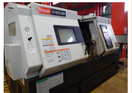
複合NC旋盤 ヤマザキマザック QTN-300M 2005.2年製 MAZATROL 640T NEXUS 管理番号:P007479 置場:東日本マシンプラザ