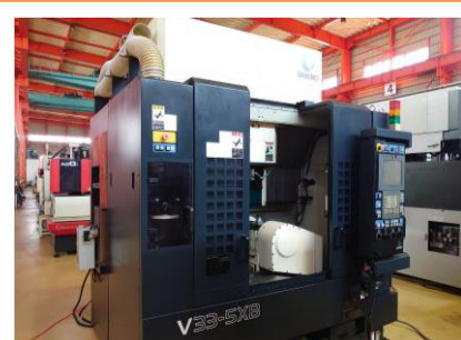
五軸加工機 牧野フライス V33-5XB 2007.1年製 Professional HSK-F63 管理番号:P007468 置場:東日本マシンブラザ