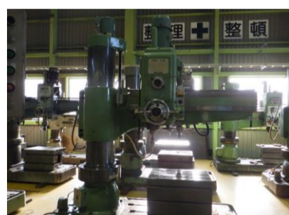
ラジアルボール盤 森精機 YR5-130 管理番号:H016551 置場:マシンプラザ本庄