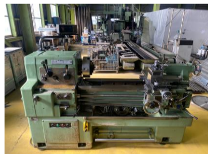
汎用旋盤 森精機 MS-850 管理番号:H016640 置場:マシンプラザ本庄