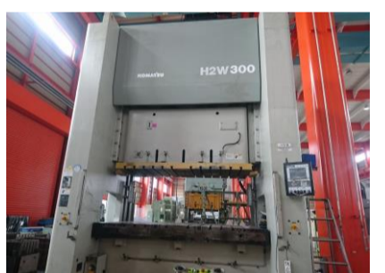
サーボプレス コマツ H2W300 2007.8年製 300t 管理番号:P006330 置場:東日本マシンプラザ