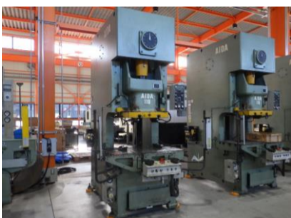
C型プレス アイダ NC1-110(2) 1991年製 110t ダイクション付 管理番号:H016446 置場:マシンプラザ本庄