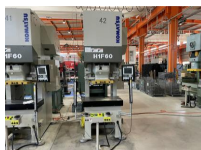
サーボプレス コマツ H1F60-11 2010年製 60t 管理番号:H016157 置場:マシンプラザ本庄