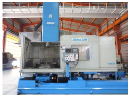
立型NC旋盤 オーエム OMEGA60M 2004年製 FANUC18i-TB 管理番号:H015395 置場:マシンプラザ本庄