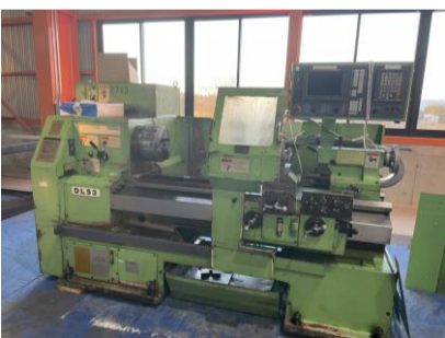
簡易型N C旋盤 大日金属 DL530×100 FANUC20i-T 10吋 管理番号:H016646 置場:マシンプラザ本庄