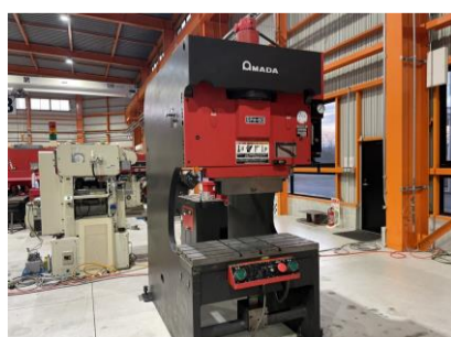
万能ベンダー アマダ SPH-60C 1998年製 60t 1000 管理番号:H016501 置場:マシンプラザ本庄