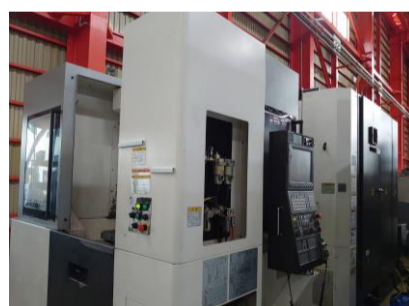
横型マシニングセンター オークマ MB-4000H 2012年製 OSP-P300M BBT40 管理番号:P007730 置場:東日本マシンブラザ