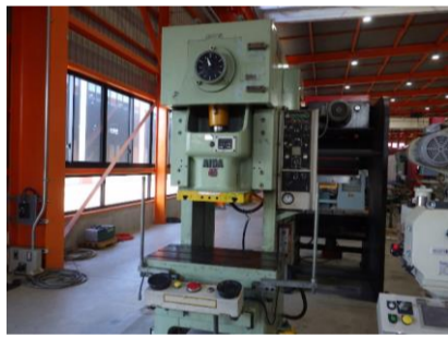
C型プレス アイダ NC1-45(2) 1989年製 45t 管理番号:H016450 置場:マシンプラザ本庄