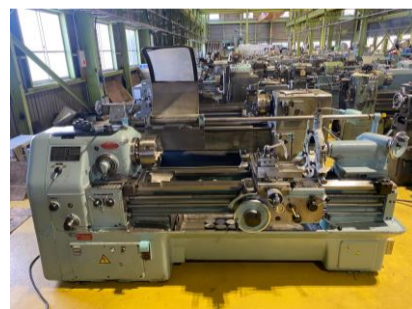
汎用旋盤 オークマ LS 10吋3爪スクロールチャック 管理番号:H016567 置場:マシンプラザ本庄