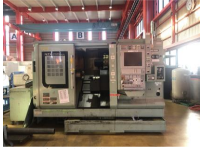
NC旋盤 森精機 NZX-2500/600 2016年製 M730BM 管理番号:P007763 置場:東日本マシンプラザ