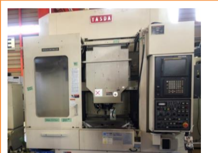
立型マシニングセンター 安田 YBM-640V2 2001年製 FANUC 16i-M BBT40 管理番号:P007801 置場:東日本マシンブラザ