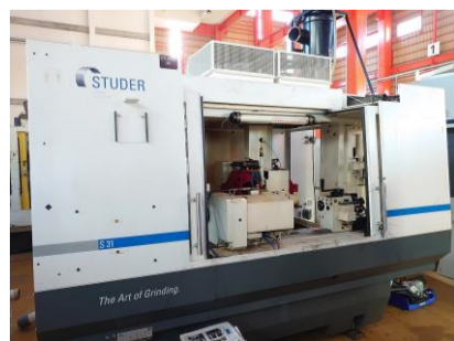
N C円筒研削盤 スチューダー S31CNC 2012年製 FANUC18i-TB 管理番号:P007754 置場:東日本マシンプラザ