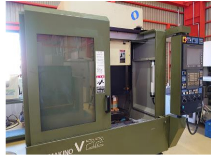
立型マシニングセンター 牧野フライス V22 2005年製 Professional5 HSK-E32 管理番号:P007691 置場:東日本マシンブラザ