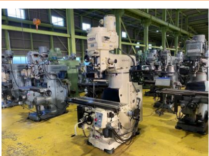
ラム型フライス 牧野フライス KVJP-55 1993年製 管理番号:H016571 置場:マシンプラザ本庄