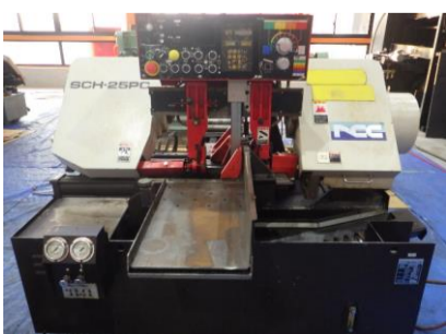
バンドソー ニコテック SCH-25PC 1998年製 丸材φ250 角材W300×H250 送 管理番号:H016536 置場:マシンプラザ本庄