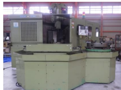
立型NC旋盤 オーエム VC-8NM 2000年製 テーブルサイズφ800 管理番号:H015064 置場:マシンプラザ本庄