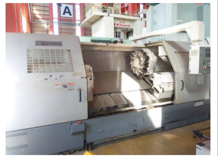
NC旋盤 オークマ LB35 II 2006年製 OSP-E100L 管理番号:P007126 置場:東日本マシンプラザ