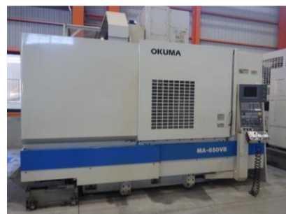
立型マシニングセンター オークマ MA-650VB 2001年製 OSP-U100L BT50 管理番号:H016303 置場:マシンブラザ本庄