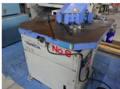
コーナresher タケダ機械 TCN-256 管理番号:H016659 置場:マシンプラザ本庄