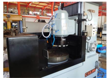
ロータリー研削盤 市川製作所 ICB-800 1992年製 チャックサイズφ650 定寸装置付 管理番号:P007757 置場:東日本マシンプラザ