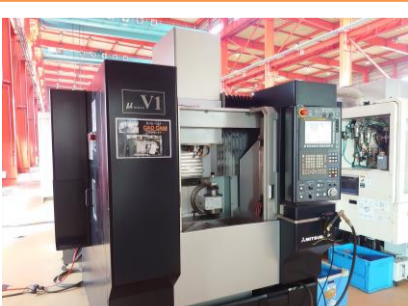
五軸加工機 三菱重工業 μV1-5X 2011年製 FANUC31i-MODEL A5 HSK-E32 管理番号:P004297 置場:東日本マシンブラザ