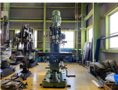
直立ボール盤 吉田 YD5-94CTN MT5 テーブルサイズ1000×500 管理番号:H016598 置場:マシンプラザ本庄