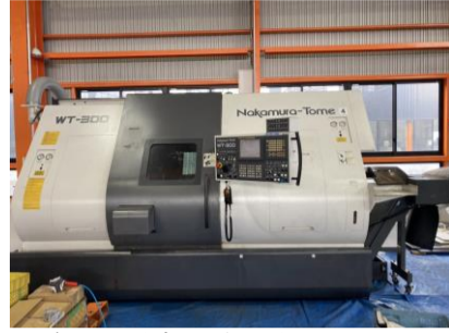
複合NC旋盤 中村留 WT-300MMY 2007年製 FANUC18iTB 管理番号:H016548 置場:マシンプラザ本庄