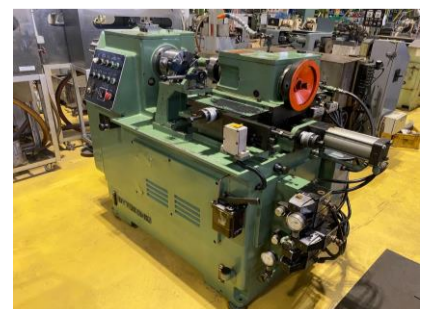
ポリゴンマシン 日東工機 PC-125 1990年製 管理番号:H016707 置場:マシンプラザ本庄