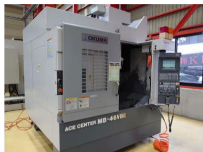
立型マシニングセンター オークマ MB-46VBE 2004年製 OSP-E10M BT50 管理番号:P007804 置場:東日本マシンプラザ