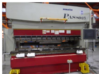
NCサーボハンダー コマツ PAS8025NET 2008.5年製 80t 2550 管理番号:H016041 置場:マシンプラザ本庄