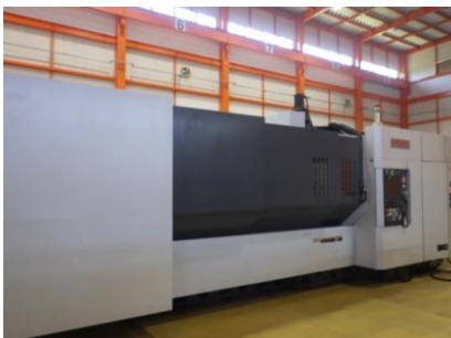
門型マシンクセンター 森精機 VS10000/40/3150 2006.8年製 MSX-501III(FANUC) BT40 管理番号:H015516 置場:マシンプラザ本庄