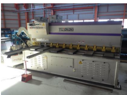
シャーリング 東洋工機 HSS-2565 2004年製 6.5×2500 管理番号:H016508 置場:マシンプラザ本庄