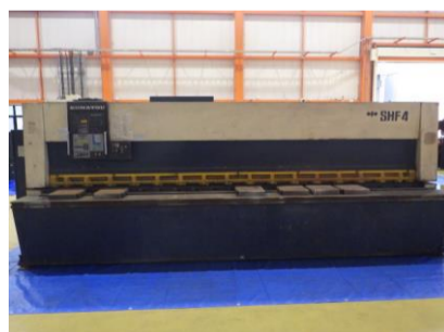
シャーリング コマツ SHF4×410 1991年製 4.5×4100 管理番号:H016348 置場:マシンプラザ本庄