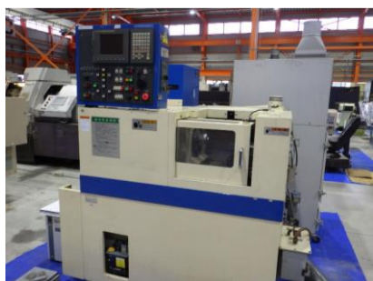
櫛刃型N C旋盤 ツガミ C004-II 2000年製 FANUC 管理番号:H016763 置場:マシンプラザ本庄