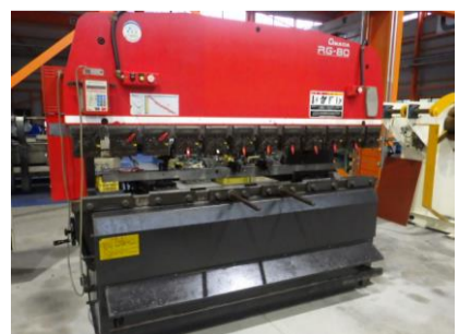
ベンダー アマダ RG-80 1998年製 80t 2400 管理番号:H016249 置場:マシンプラザ本庄