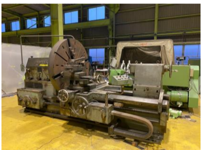
正面旋盤 藤井精機 60-6FLH-15 1983年製 1500φ4爪単動チャック 心間1500 管理番号:H016632 置場:マシンプラザ本庄