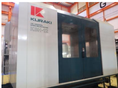
NC横中ぐり盤 倉敷機械 KBH-12 2007.11年製 FANUC16i-MB 管理番号:H015805 置場:マシンプラザ本庄