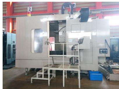
五軸加工機 大隈豊和 MILLAC-1000VH 2001.8年製 FANUC16i-M BT40 管理番号:P005576 置場:東日本マシンプラザ