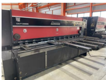
シャーリング アマダ DCT-2565 1987年製 6.5×2500 管理番号:H016502 置場:マシンプラザ本庄