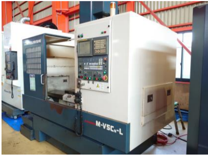
立型マシニングセンター 三菱重工業 M-V5CNL 2003年製 FANUC-18i-M BT40 管理番号:P007666 置場:東日本マシンブラザ