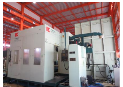
NC横中ぐり盤 倉敷 KBT-11M-ANT8P 2002.12年製 FANUC-16iMB 管理番号:H013773 置場:マシンプラザ本庄