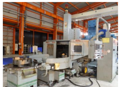
立型NC旋盤 オーエム VL-6N 1990年製 FANUC15-T チャックサイズφ610 管理番号:H014549 置場:マシンプラザ本庄