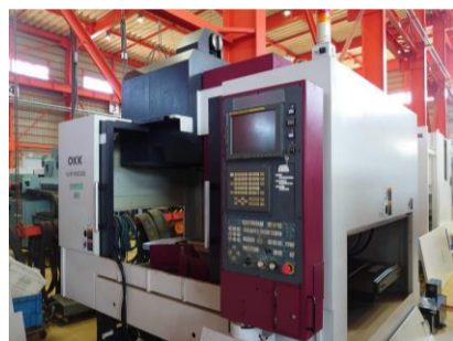
立型マシニングセンター OKK VM5III 2006年製 FANUC180is-MB BT50 管理番号:P007824 置場:東日本マシンプラザ