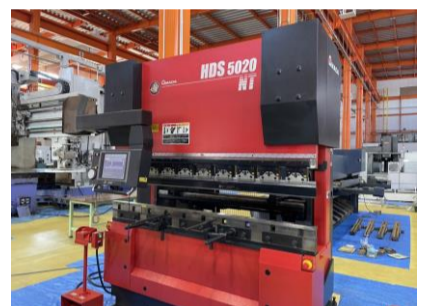
NCベンダー アマダ HDS-5020NT 2004年製 NT 50t 2070 管理番号:H016439 置場:マシンプラザ本庄