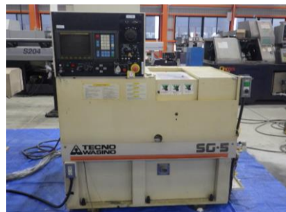
櫛刃型NC旋盤 テクノワシノ SG-5 1995.1年製 FANUC0-T コレットチャック 管理番号:H016431 置場:マシンプラザ本庄