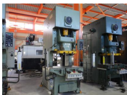
C型プレス アイダ NC1-110(2) 1991年製 110t ダイクション付 管理番号:H016447 置場:マシンプラザ本庄