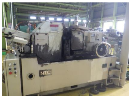
センターレス NTC CLG-2B II 1990年製 砥石サイズ610×205×304.8 管理番号:H016378 置場:マシンプラザ本庄