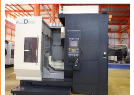
五軸加工機 牧野フライス D500 2008.9年製 Professional 5 HSK-A63 管理番号:H015918 置場:マシンブラザ本庄