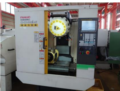
トリングセンター ファナック α-D14MiA5 2016年製 FANUC 3i1-MODEL B5 BBT30 管理番号:P007852 置場:東日本マシンプラザ