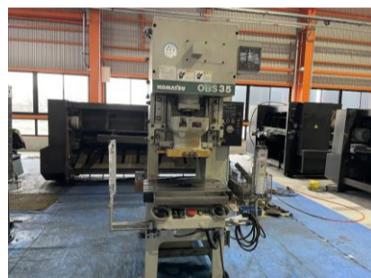
C型プレス コマツ OBS35-33B 2002年製 35t 管理番号:H016754 置場:マシンプラザ本庄