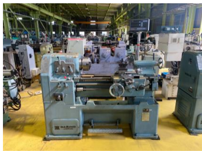
汎用旋盤 ワシノ LR-55A 心間550 管理番号:H016705 置場:マシンプラザ本庄