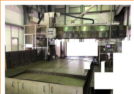
五面加工機 三菱 MVR40 2006.4年製 FANUC18i-MB BT50 管理番号:H014504 置場:マシンブラザ本庄