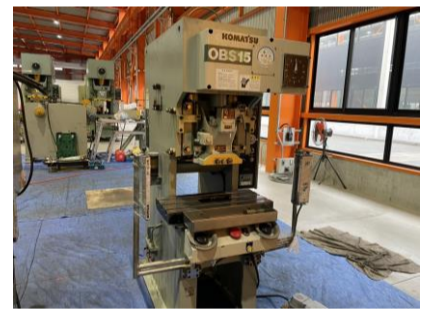
C型プレス コマツ OBS15-B 2000年製 15t 管理番号:H016751 置場:マシンプラザ本庄