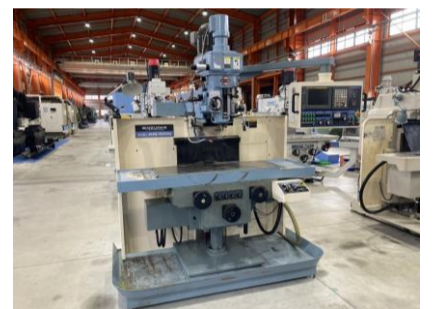
N C立フライス 静岡鉄工 AN-SRN 2004年製 FANUC20i-F NT40 管理番号:H016688 置場:マシンプラザ本庄