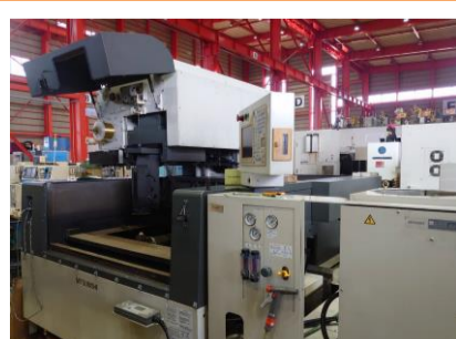
NCワイヤーカット 三菱電機 FA30VM 2005年製 管理番号:P007791 置場:東日本マシンプラザ