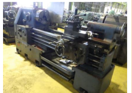
汎用旋盤 滝沢 TAL-560 1982年製 12吋3爪スクロールチャック(JN12T) 管理番号:H016601 置場:マシンプラザ本庄