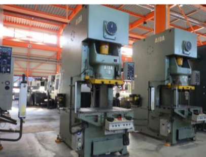
C型プレス アイダ NC1-110(2) 1991年製 110t タイクッション付 管理番号:H016448 置場:マシンプラザ本庄