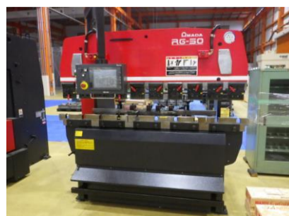
ベンダー アマダ RG-50 2007年製 50t 2000 管理番号:H016254 置場:マシンプラザ本庄