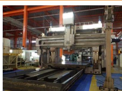
五面加工機 オークマ MCR-B II 35×50 2004.7年製 OSP-E100M BBT50 管理番号:H015701 置場:マシンブラザ本庄