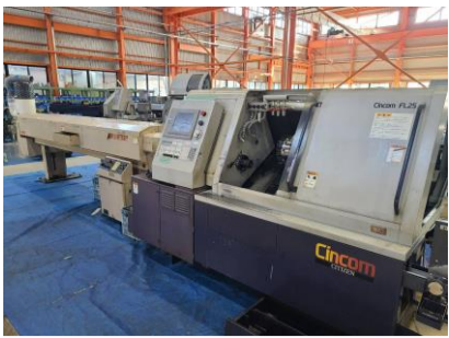
NC自動盤 シチズン FL-25 1996年製 MELDAS 管理番号:H016530 置場:マシンプラザ本庄