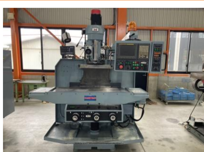
NC立フライス 春日 RNC-80 2008年製 FANUC20i-FB NT40 管理番号:H016655 置場:マシンプラザ本庄