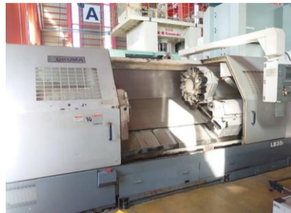
NC旋盤 オークマ LB35 II 2006年製 OSP-E100L