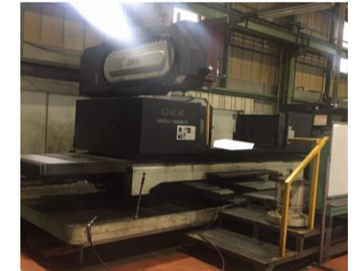
立型マシニングセンター OKK MCV-1260 2007.2年製 FANUC160is-MB BT50 管理番号:H016444 置場:マシンプラザ本庄