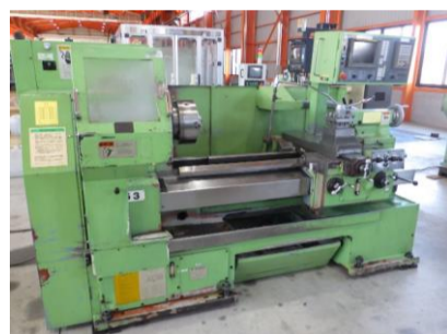
簡易型NC旋盤 大日金属 DL530 x 100 FANUC20i-T 10吋