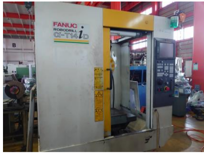
ドリリングセンター ファナック \alpha -T14iD 2003年製 FANUC16i-MB 管理番号:P007819 置場:東日本マシンプラザ