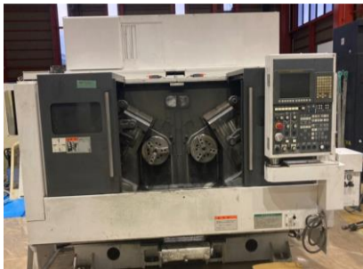
NC旋盤 滝沢 TT-2600 2016年製 FANUC0i-TD 平行2スピンドル