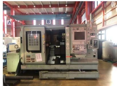
NC旋盤 森精機 NZX-2500/600 2016年製 M730BM