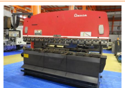
ベンダー アマダ RG-100 1992年製 100t 1000 管理番号:H016719 置場:マシンプラザ本庄