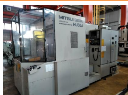
横型マシニングセンター 三井精機 HU50A 2000年製 FANUC16-M BT40 管理番号:P006779 置場:東日本マシンプラザ