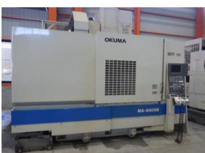
立型マシニングセンター オークマ MA-650VB 2001年製 OSP-U100L BT50 管理番号:H016303 置場:マシンプラザ本庄