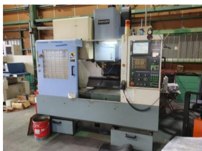
立型マシニングセンター 静岡 B-7VHS 2005年製 FANUC18-iMB 管理番号:P007784 置場:東日本マシンプラザ