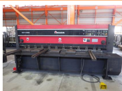
シャーリング アマダ DCT-2565 1991年製 6.5×2500 管理番号:H016656 置場:マシンプラザ本庄