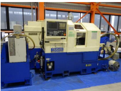
NC自動盤 ツガミ BU20 2006年製