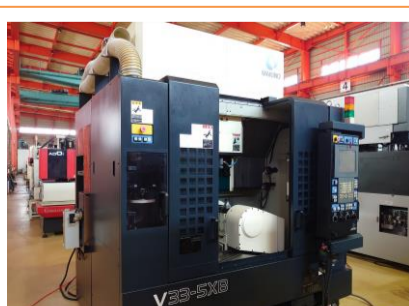
五軸加工機 牧野フライス V33-5XB 2007.1年製 Professional HSK-F63 管理番号:P007468 置場:東日本マシンプラザ