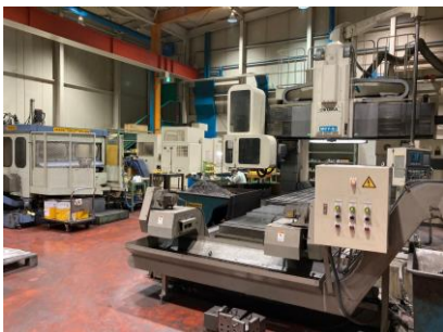
門型マシニングセンター オークマ MCV-16AII 16×30 2000年製 OSP-U100L BT50 管理番号:H016062 置場:マシンプラザ本庄