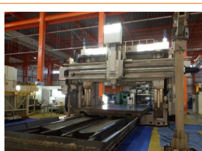
五面加工機 オークマ MCR-B II 35×50 2004.7年製 OSP-E100M BBT50 管理番号:H015701 置場:マシンプラザ本庄