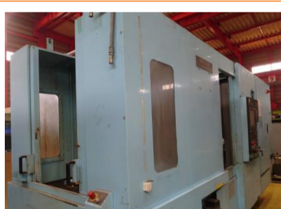
横型マシニングセンター 森精機 NH5000/40 2006年製 MSX-501(FANUC) BT40 管理番号:P007770 置場:東日本マシンプラザ