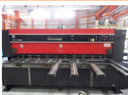
シャーリング アマダ DCT-2565 1987年製 6.5×2500 管理番号:H016502 置場:マシンプラザ本庄