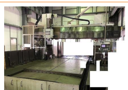
五面加工機 三菱 MVR40 2006.4年製 FANUC18i-MB BT50 管理番号:H014504 置場:マシンプラザ本庄