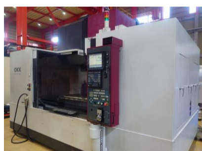
立型マシニングセンター OKK VM7III 2007年製 Neomatic730 BT50 管理番号:P007759 置場:東日本マシンプラザ