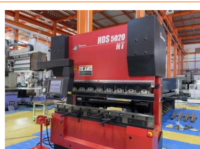
NCベンダー アマダ HDS-5020NT 2004年製 NT 50t 2070 管理番号:H016439 置場:マシンプラザ本庄