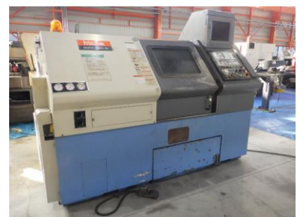
NC旋盤 ヤマザキマザック QT-20 1998年製 MAZATROL T PLUS 8吋