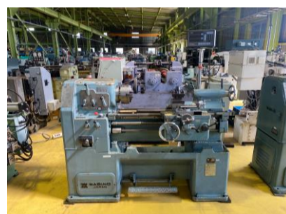
汎用旋盤 ワシノ LR-55A 心間550