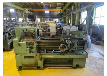
汎用旋盤 森精機 MS-850 心間850