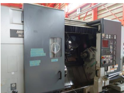
複合NC旋盤 森精機 MT2000 alpha 1SZ 2003年製 MSD-502