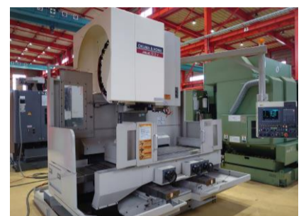
立型マシニングセンター 大隈豊和 MILLAC-511V 1999年製 OSP-U100M BT40 管理番号:P007750 置場:東日本マシンプラザ