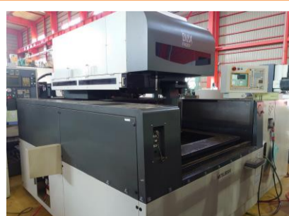
NCワイヤカット 三菱電機 FA30VM 2005年製 W21FAV-2