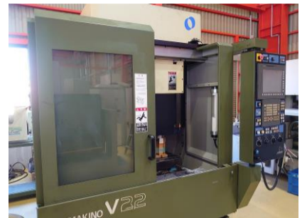
立型マシニングセンター 牧野フライス V22 2005年製 Professional5 HSK-E32 管理番号:P007691 置場:東日本マシンプラザ