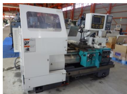
簡易型NC旋盤 滝沢 TAC-460A 2000年製 FANUC20T 9吋3爪スクロールチャック