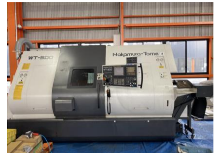
複合NC旋盤 中村留 WT-300MMY 2007年製 FANUC18iTB