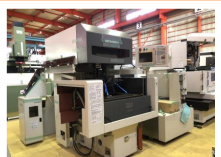
NCワイヤカット 三菱電機 FA10SM 2004年製 W21FAS-2