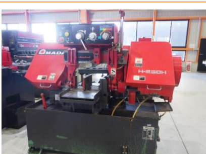
バンドソー アマダ H-250H 1997年製 丸材φ250 角材250×300 管理番号:H016511 置場:マシンプラザ本庄