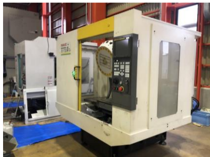
ドリリングセンター ファナック \alpha -T21iDL 2004年製 FANUC16i-M 管理番号:P007884 置場:東日本マシンプラザ