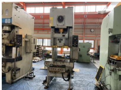
C型プレス アイダ NC1-80(2) 80t 管理番号:H016615 置場:マシンプラザ本庄