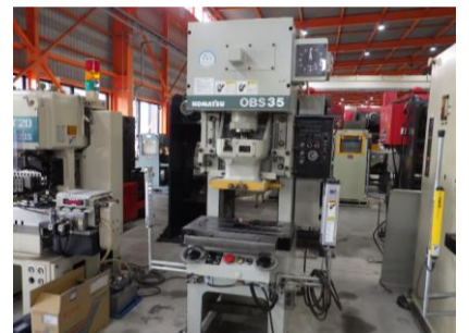
C型プレス コマツ OBS35-33B 2002年製 35t 管理番号:H016754 置場:マシンプラザ本庄