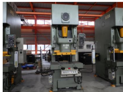
C型プレス アイダ NC1-110(2) 1991年製 110t ダイクッション付 管理番号:H016448 置場:マシンプラザ本庄