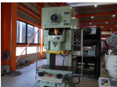
C型プレス アイダ NC1-45(2) 1989年製 45t 管理番号:H016450 置場:マシンプラザ本庄