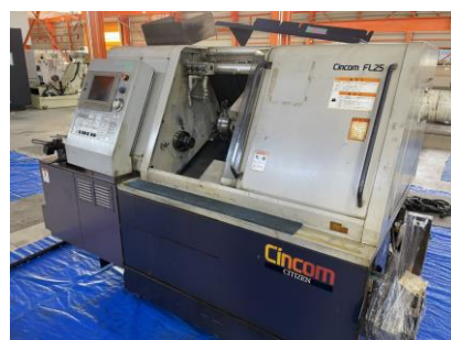
NC自動盤 シチズン FL-25 2000年製 MELDAS コレットチャック