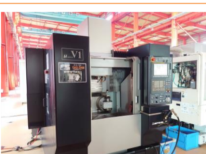
五軸加工機 三菱重工業 \mu V1-5X 2011年製 FANUC31i-MODEL A5 HSK-E32 管理番号:P004297 置場:東日本マシンプラザ