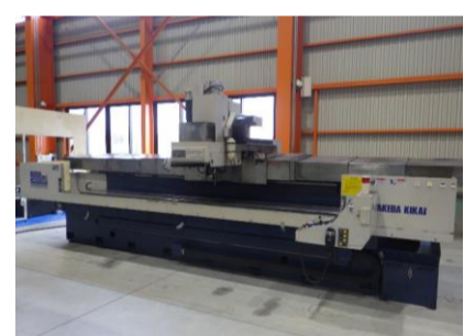
立型マシニングセンター 武田機械 TK45S-4000MV-4 2006.12年製 FANUC0i-MC BT40 管理番号:H016183 置場:マシンプラザ本庄