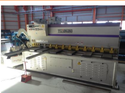
シャーリング 東洋工機 HSS-2565 2004年製 6.5×2500 管理番号:H016508 置場:マシンプラザ本庄