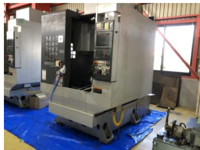
立型マシニングセンター 森精機 ACCUMILL4000 2005年製 MSX-805(MELDAS) BT30 管理番号:P007815 置場:東日本マシンプラザ