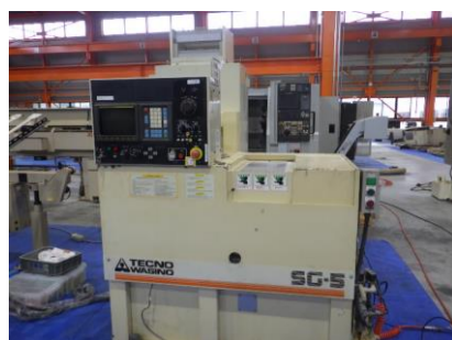
NC自動盤 テクノワシノ SG-5 1996年製 FANUC0-T コレットチャック