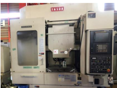
立型マシニングセンター 安田 YBM-640V2 2001年製 FANUC 16i-M BBT40 管理番号:P007801 置場:東日本マシンプラザ