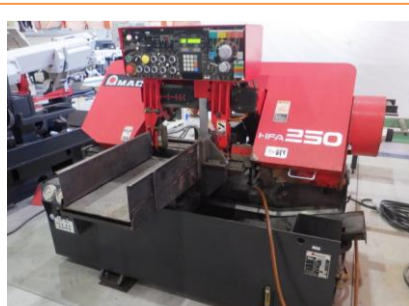
バンドソー アマダ HFA-250 1998年製 丸材φ250 角材300×250(幅×高) 管理番号:H016712 置場:マシンプラザ本庄