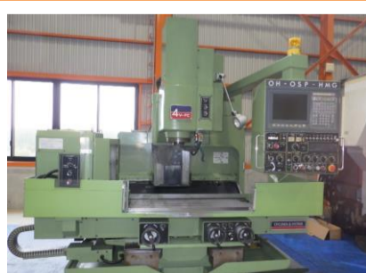
NC立ワイヤ 大隈豊和 4V-FC 1990年製 OH-OSP-HMG NT50