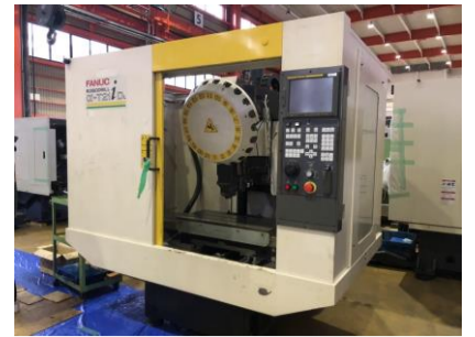
ドリリングセンター ファナック \alpha -T21iDL 2004年製 FANUC16i-M 管理番号:P007882 置場:東日本マシンプラザ