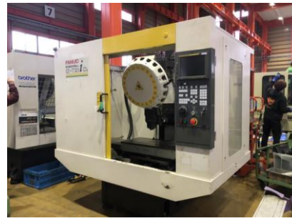
ドリリングセンター ファナック \alpha -T21iDL 2004年製 FANUC16i-M 管理番号:P007881 置場:東日本マシンプラザ