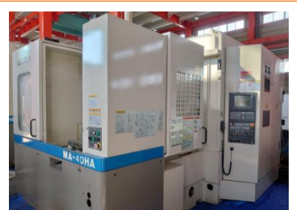
横型マシニングセンター オークマ MA-40HA 2001年製 OSP-E100M BT40 管理番号:P007747 置場:東日本マシンプラザ