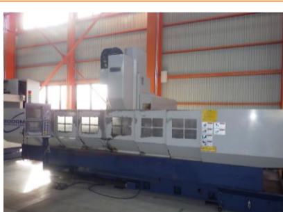
立型マシニングセンター 武田機械 TK20S-3000MV-5 2012年製 FANUC 0i-MD BT50 管理番号:H016708 置場:マシンプラザ本庄