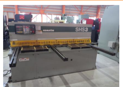
シャーリング コマツ SHS3×205 1996年製 3×2050 管理番号:H016392 置場:マシンプラザ本庄