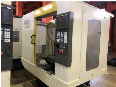
ドリリングセンター ファナック \alpha -T21iDL 2004年製 FANUC16i-M 管理番号:P007883 置場:東日本マシンプラザ