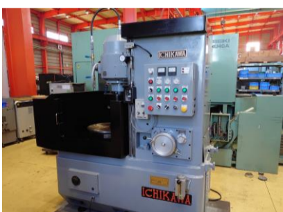
ロータリー研削盤 市川製作所 ICB-603 1991年製 チャックサイズφ500 ★2022年O/H