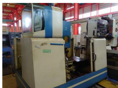
立型マシニングセンター 碌々産業 VERTIMAC-K 1989年製 FANUC 0-M BT40 管理番号:P007821 置場:東日本マシンプラザ