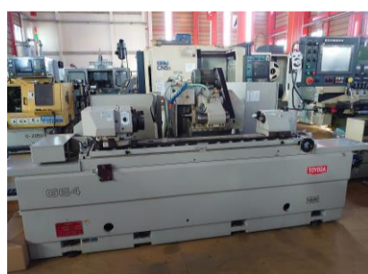
NC円筒研削盤 豊田 GE4P-100 II 2008.2年製 内研付